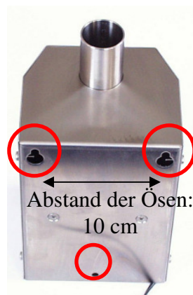
AEROM- Power Wandgerät (Rückseite)

Die 3. Schraube wird zur Fixierung von innen durch die Bohrung am unteren Rand gedreht.